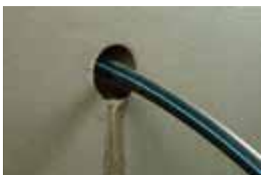
1. Течащ отвор...

Иновационният продукт KÖSTER KB-Flex 200 решава тези детайли по лесен и удобен начин. Така той спестява време и ресурси, осигурявайки една лесно изпълнима и надеждна хидроизолация.