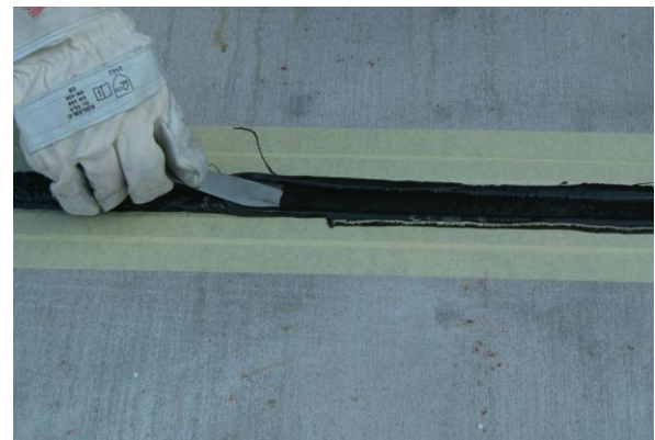
Загладете покритието с шпатула.