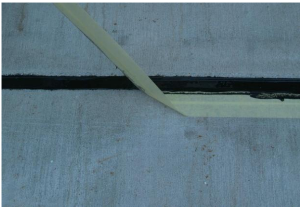
Махнете предпазната лепенка.