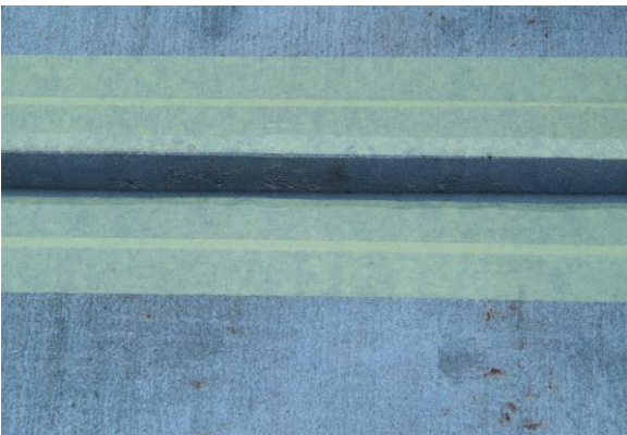
Облепете двете страни на фугата с предпазна лепенка.