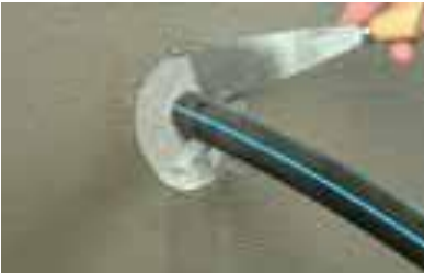
5. ... удобно...