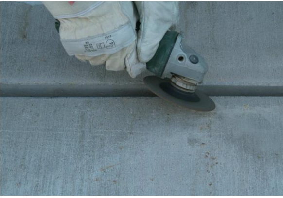
Загладете ръбестите краища на фугата.