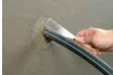
6. ... и дълготрайно.

Обработката завършва с направата на циментово-пясъчна запушалка или полагането на KÖSTER KB-Fix 1 върху пълнежа от KÖSTER KB-Flex 200 с цел запазване целостта му или предотвратяване на избутването му от отвора при продължително действие на вода под налягане.