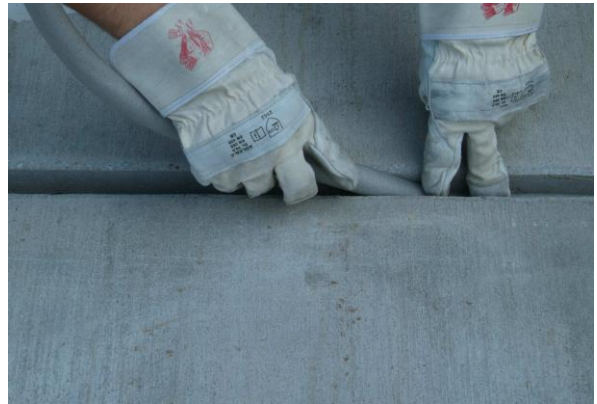
Поставете ограничителна подложка, за да фиксирате необходимата дебелина на фугата.