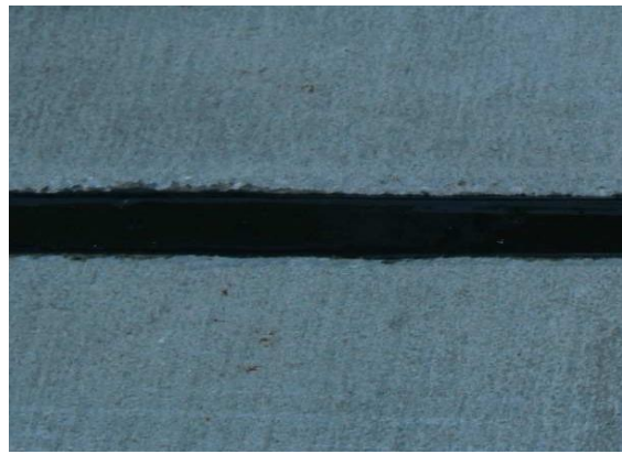
Край на обработката.