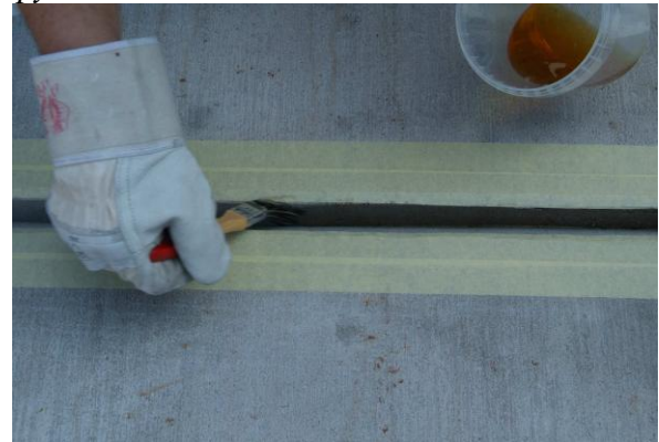
Намажете стените на фугата с FS-грунд.