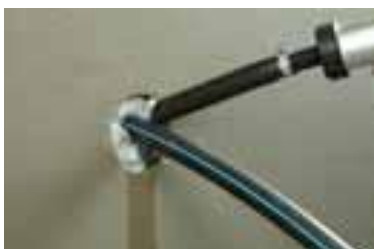
4. ...незабавно, лесно...