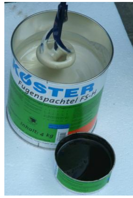
Разбъркайте добре двата компонента.