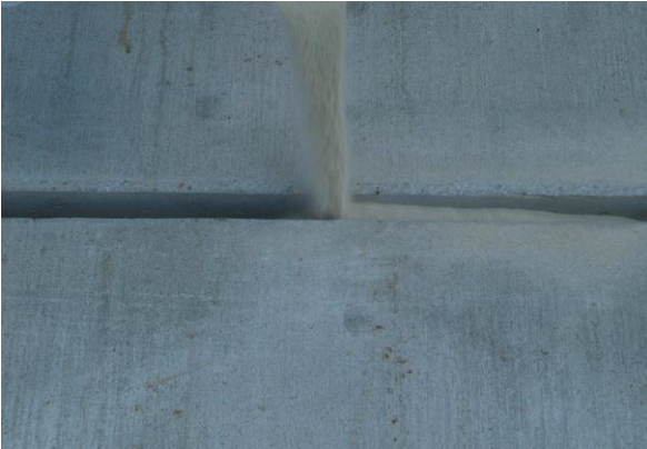
Запълнете част от фугата с пясък, за да запълните част от празния обем.