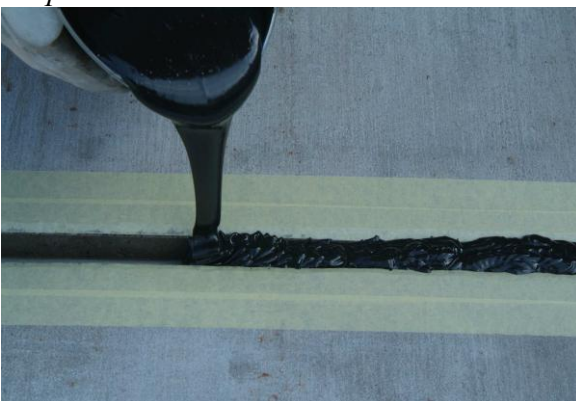
Изсипете във фугата разтворът FS-H