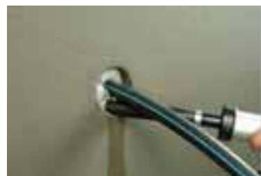
3. ...с KÖSTER KB-Flex 200 ...