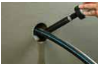
2. ...се изолира...